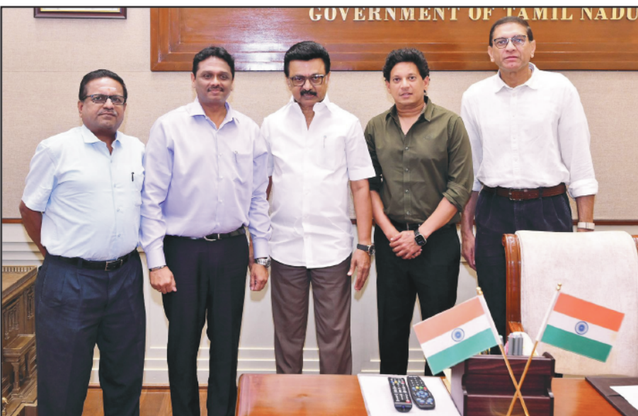
Tamil Nadu Chief Minister M.K. Stalin congratulated the new office-bearers of Tamil Nadu Cricket Association headed by T.J. Srinivasraj.